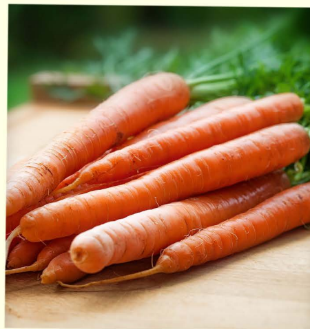
zanahorias (f. pl)