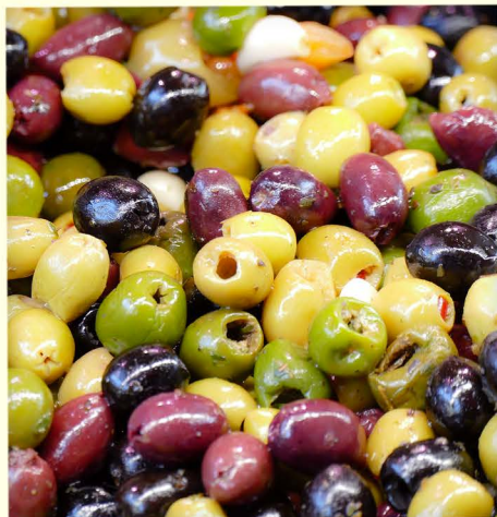
aceitunas (f. pl)